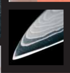
Detalle del bellissimo Damasco de estos cuchillos