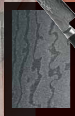
Detalle del bellissimo Damasco de estos cuchillos